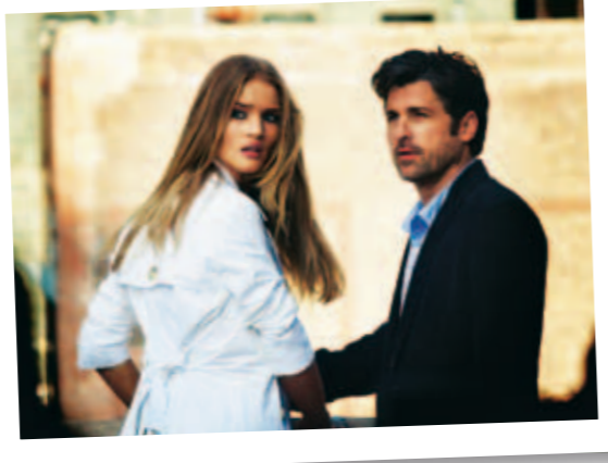
Zwischen zwei Männern: In „Transformers 3“ muss sich Rosie Huntington-Whiteley zwischen dem Guten (Shia LaBeouf, oben) und ihrem bösen Chef (Patrick Dempsey, links) entscheiden